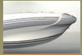
RUMPF IN TIEFER V-FORM