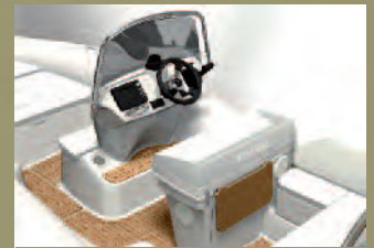
AIR KONSOLE + BOLSTER

DIE 3 NEUEN SEMI-RIGID N-ZO WARTEN MIT INNOVATIONEN AM RUMPF UND AN DECK AUF.