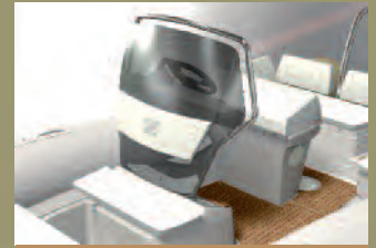
AIR KONSOLE (N-ZO 600/N-ZO 680)