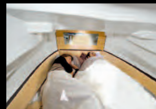
„KING SIZE“ LIEGEFLÄCHE